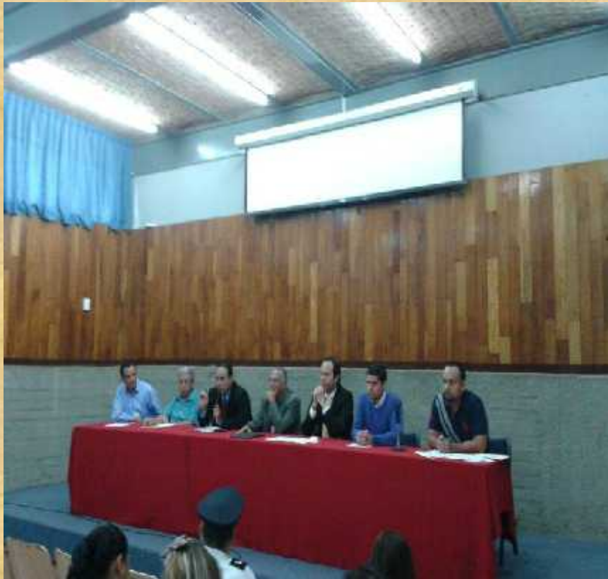
CONSOLIDACIÓN DEL ACUERDO DE COLABORACIÓN.

La primera fase denominada de Sensibilización y Socialización donde se pactó con las autoridades escolares el proceder y consolidación del acuerdo de colaboración para llevar a cabo el programa.